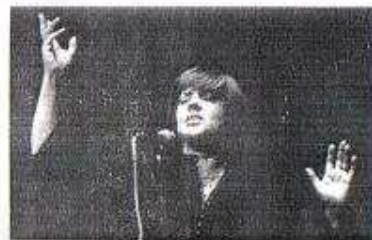
(María Elena Walsh -)

Walsh ha sabido hacer vibrar a su público como pocos artistas, interpretando el sentir de los argentinos con un lenguaje sencillo y auténtico. Su trayectoria personal en defensa de los valores humanos la convierten en una mujer íntegra, coherente con sus propios ideales, a través de todas sus expresiones artísticas, durante una larga vida, que ha merecido innumerables distinciones y homenajes.