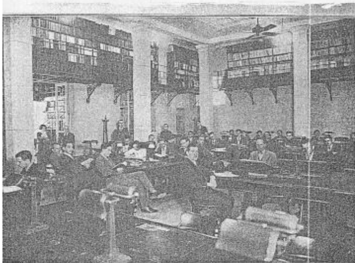
Salón de lectura para lectores de obras

El archivo perteneciente a la antigua Biblioteca de la Esc. Superior de Comercio, data del año 1935