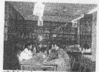
sala de lectura hoy

A la comisión de Seguridad e Higiene, se le elevó un pedido de soluciones edilicias para la Biblioteca, comenzando por más espacio para la Sala de Lectura.